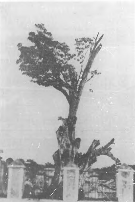
Árbol a cuya sombra reposó Colón después de la batalla con los indios en el "Santo Cerro".

en su verdor eterno y con el cañón de los conquistadores engullido, dentro de su corazón; adivinándose a través de la albuja del árbol, el listón de hierro