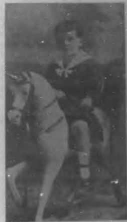
A E OTRA PHASE

Curioso con sus brazos me aminoró la mano, de luego besó la cruz de su castillo de oro. Yo mezo un tribulador, porque lazo y amargura. ¿Quién al aliviar su furor, se me resaca a tu amor? Sigue tu camino, hermano, con sus ríos, ¡Ay, la vida! ¿Qué más aguarda con ellos, en tu castillo de oro?