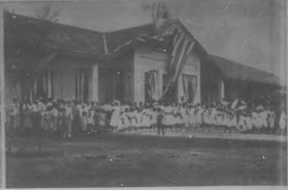
Estación Jovellanos.—Aspecto del andén de la estación y de la concurrencia el día de la inauguración verificada el 20 del pasado. Fachada de la estación, frente a la calle Martí.—Foto: José Rodríguez González

cionado aquél, en el acreditado jardín "El Clavel", de los hermanos Armand, modelo María Antonieta, de mucho gusto.