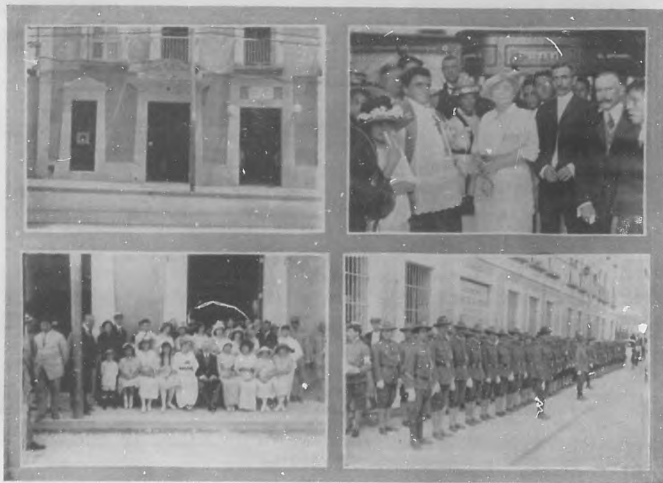
DE LA CRUZ ROJA — Nuevo puesto de Emergencias. Vista de la fachada del edificio donde está instalado el nuevo puesto. El señor Secretario de Gobernación y su distinguida esposa en el acto de la inauguración del nuevo puesto de Emergencias, en cuyo acto han figurado como padrinos. Vista de los concurrentes al acto de la inauguración del puesto de Emergencias. Fuerzas de la Cruz Roja listas para ser visitadas por el Sr. Secretario de Gobernación.

con lo macabro, lo fuerte y a veces hasta la exarcebación.