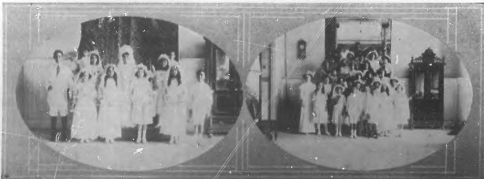
EN EL CENTRO DE DEPENDIENTES.—Grupo de niñas que tomaron la primera comunión en la pasada semana pertenecientes al Planeta que sostiene dicha Asociación.—Grupo de familiares que acompañaron a sus niños a realizar el piadoso acto.